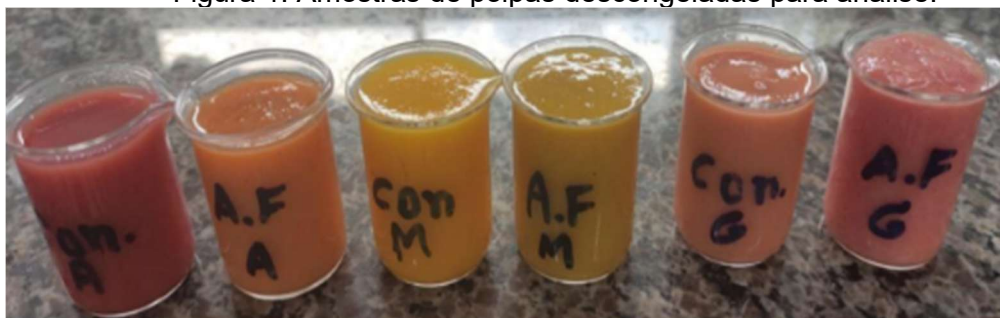
Figura 1. Amostras de polpas descongeladas para análise.

característico para cada fruta utilizada. De acordo com o informado, as polpas da agricultura familiar apenas continham a fruta da referida polpa sem acréscimo de qualquer produto de outra natureza, com validade de seis meses. Por outro lado, as polpas convencionais possuíam conservante (INS 211) e acidulante (INS 330) em todos os sabores analisados, válido por doze meses conforme indicado nas embalagens.