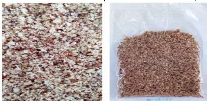
Figura 5 - Farinha da amêndoa do licuri: ampliada e embalada à vácuo, respectivamente.