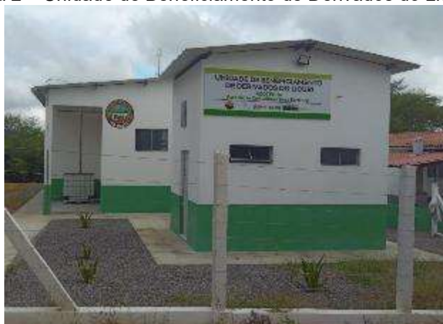
Figura 2 – Unidade de Beneficiamento de Derivados do Licuri da EFASE.

A farinha de licuri já faz parte do conhecimento gastronômico das mulheres e famílias tradicionais da zona rural de regiões marcadas pelo extrativismo articulado e dinâmico do licuri (13). Na região de Monte Santo no Estado da Bahia, a farinha de licuri produzida por estas famílias se deteriora em poucos dias pela falta de tecnologia ou método de produção que possibilite a sua conservação de forma eficaz, inviabilizando a sua comercialização. A farinha de licuri pode ser utilizada na forma integral ou como matéria-prima para enriquecimento de outras farinhas amplamente comercializadas, como a farinha de trigo, de milho e de mandioca, contribuindo para aumentar o teor de proteínas e carotenoides e fornecendo um grande diferencial as farinhas tradicionais. Além disso, pode ser utilizada para fabricação de diversos produtos, como pães, biscoitos, bolos, entre outros.