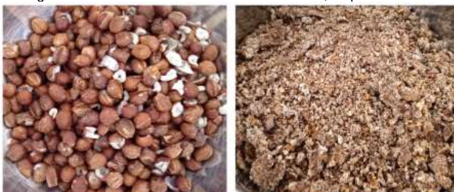
Figura 3 - Amêndoa seca de licuri e torta de licuri, respectivamente.

Para o desenvolvimento da farinha de licuri, foram testados por duas abordagens: um a partir da amêndoa seca de licuri, que será referida neste trabalho como FA (farinha da amêndoa) e outro a partir da torta de licuri, denominada FT (farinha da torta). A Figura 3 ilustra as matérias-primas para produção de FA e FT. A torta de licuri é um subproduto sólido gerado após a extração do óleo de licuri por prensagem a frio das amêndoas secas. Ressalta-se que, mesmo após a prensagem a frio, a torta de licuri ainda mantém certa quantidade de óleo em sua composição, sendo importante o seu imediato processamento ou congelamento, a fim de prevenir a deterioração da torta de licuri.